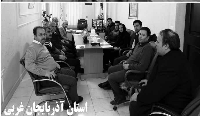
استان آذربایجان غربی