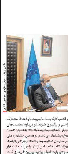
جلسه مشترک رؤسای سازمان صداوسیما و سازمان سینمایی برگزار شد

نمایشگاه مجازی کتاب تهران Tehran Virtual Book Fair