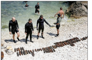
پاک‌سازی بستر دریای آدریاتیک از سلاح‌های به جا مانده از جنگ دوم جهانی