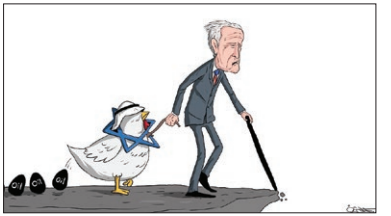
حرکت سازشکاران به سوی پرتگاه / کاریکاتور «کمال شرف» هنرمندی میمنی