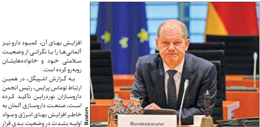
اوااف شولتز یک سال نخست خود در کسوت صدراعظمی را با انتقادهای فراوان سپری کرد

با وجود این، حتی همین شبکه هم اذعان داشت که وقوع چنین خاموشی‌هایی از جنگ جهانی دوم به این سو بی‌سابقه بوده است.