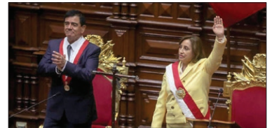
مراسم تحلیف نخستین رئیس جمهور زن تاریخ پرو