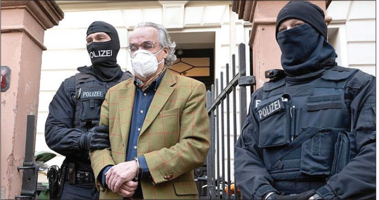
سیزدهم حتی اعضای کابینه آینده خود را نیز انتخاب کرده بود. از جمله این افراد می توان به

رئیس جمهور چین در حالی در ریاض به سر می برد که روابط آمریکا و عربستان سعودی در برهه حساسی قرار دارد. امنیت انرژی، امنیت منطقه ای و حقوق بشر ۳ موضوعی هستند که روابط ریاض و واشنگتن را متشنج کرده اند. حمله نظامی روسیه به اوکراین و موضع سخت