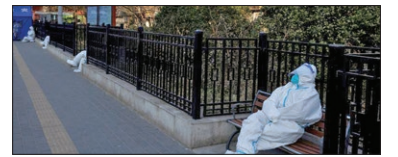
نگهبانان ۲۴ ساعته ساختمان های قرظنینه شده به دلیل شیوع کرونا در شهر یکن چین