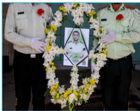
مراسم وداع با پیکر شهید مدافع امنیت در اهواز