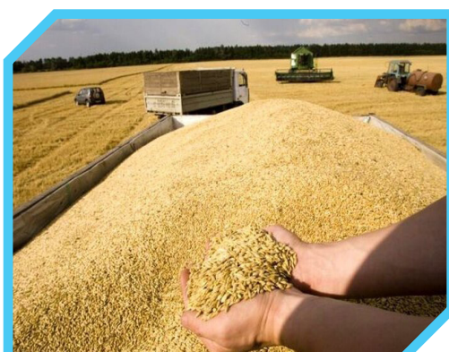
غوغای برداشت و ذخیره سازی گندم در خوزستان