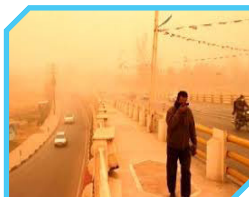
هوای ۲ شهر خوزستان برای گروه های حساس ناسالم است