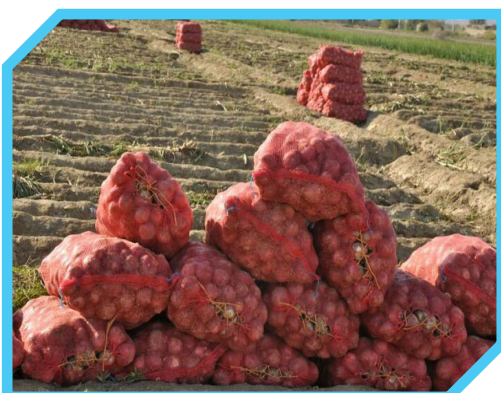
برداشت پیاز از مزارع دزفول آغاز شد