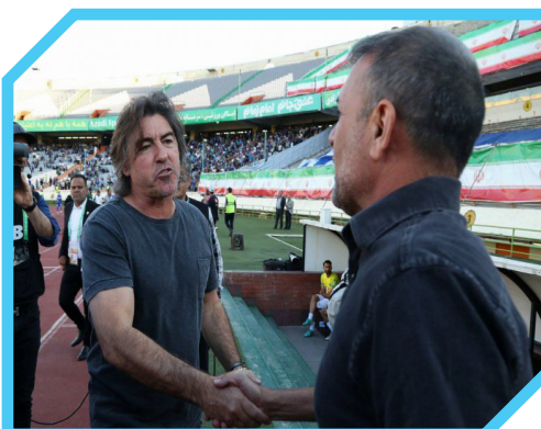
خنده‌های عبدالله ویسی بعد از جمعه جنجالی