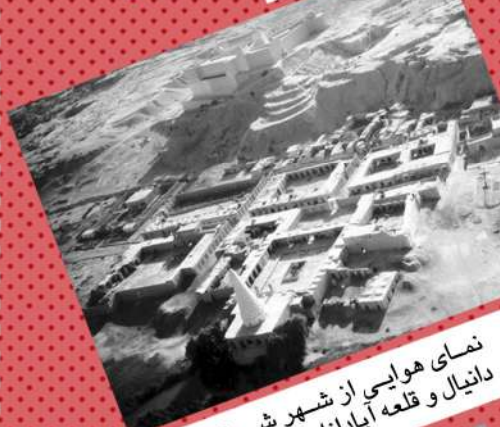
نمای هوایی از شهر شوش که مرقد پیامبر دانیال و قلعه آپادانا در آن مشخص است