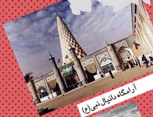
آرامگاه دانیال نبی (ع)