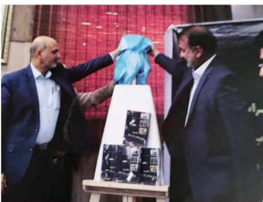
رونمایی از کتاب روایت خوزستان در سینمای ایران توسط مدیر کل وقت فرهنگ و ارشاد اسلامی خوزستان