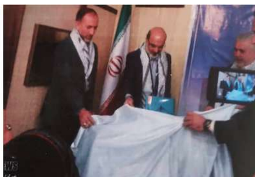
رونمایی از کتاب ۶۰ سال رادیو و تلویزیون خوزستان توسط مدیر وقت صدا و سیما جمهوری اسلامی ایران