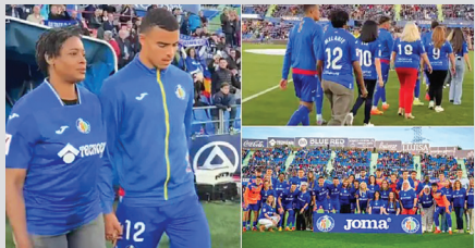
این موضوع هم مناسبت روز مادر در اسپانیا بود و مدیران باشگاه مادریدی با این ایده، سبب دیده شدن تکرمی مقام مادر در سراسر دنیا شدند. نکته جالب دیگر اینکه بازیکنان

این تیم که برخی در کنار مادر و برخی دیگر دست به دست همسرشان بودند، برای بازیکنان رقیب تونل افتخار زدند تا به این ترتیب قهرمانی آنها در جام حذفی را تبریک بگویند. بیلانو در نهایت این مسابقه را با دو گل به سود خود به اتمام رساند اما قابی که سرشار از احترام و نوع دوستی بود، بالاتر از نتیجه قرار گرفت. اینجا هم از هواداران گرفته تا مربیان و بازیکنان، از یک هفته قبل از بازی‌های مهم نفرت‌پراکنی را شروع می‌کنند و برای کمتر کسی مهم است که دیدن حرکات داخل و خارج از زمین کسانی که ممکن است الگوی عده زیادی باشند، چه انحطاط بزرگی از لحاظ فرهنگی به وجود می‌آورد.